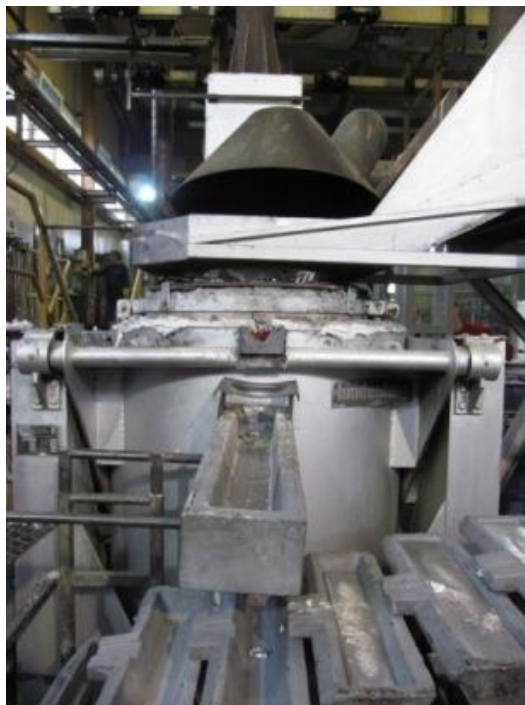
dopravník pro odlévání ingotů