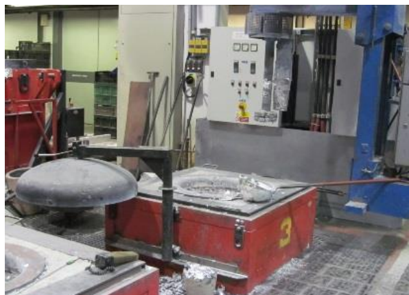
ohřev kovu pro odlévání